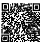
แบบฟอร์มรายงาน การกำกับ ติดตาม ของ ศปท.

เลขาธิการคณะกรรมการป้องกันและปราบปรามการทุจริตในภาครัฐ