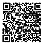
QR CODE คู่มือฯ ประจำปี พ.ศ. ๒๕๖๙